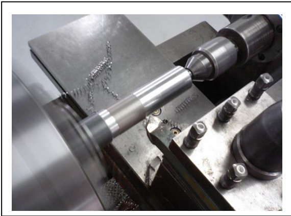
加工の様子 (真剣バイトによる外丸削り)