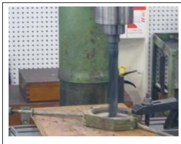
加工の様子（ドリルによる穴あけ）